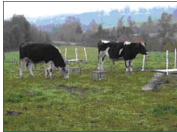
Vista parcial de la implementación de la metodología de lisímetros superficiales en terreno (Izquierda) y de la ubicación de las cápsulas cerámicas durante el pastoreo (Derecha).