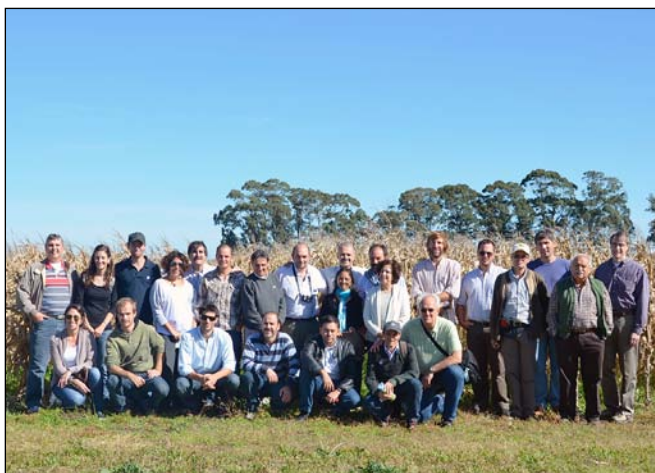
Grupo de investigadores visitando el ensayo de sistemas intensificados de Balcarce en Abril 2012.

Sinclair, T.R., y T. Horie. 1989. Leaf nitrogen, photosynthesis and crop radiation use efficiency: A review. Crop Science , 29:90-98. 🌱