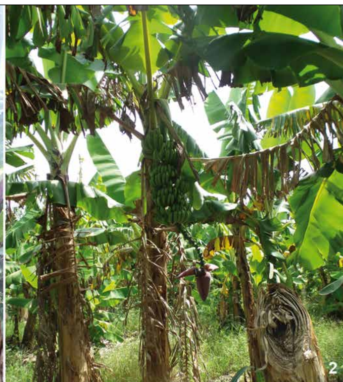
Foto 1. Racimos cosechados en tratamiento 2.